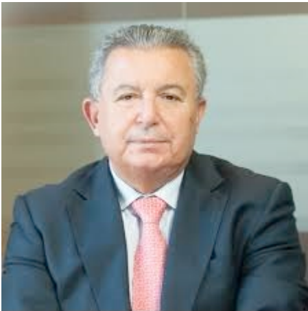
Artigo escrito por José Bancaleiro Stanton Chase - Managing Partner www.stantonchase.com

A nós, gestores de Activos Humanos, cabe-nos o papel de proteger a dignidade das nossas pessoas e os interesses das nossas organizações, criando condições que evitem este tipo de situações.