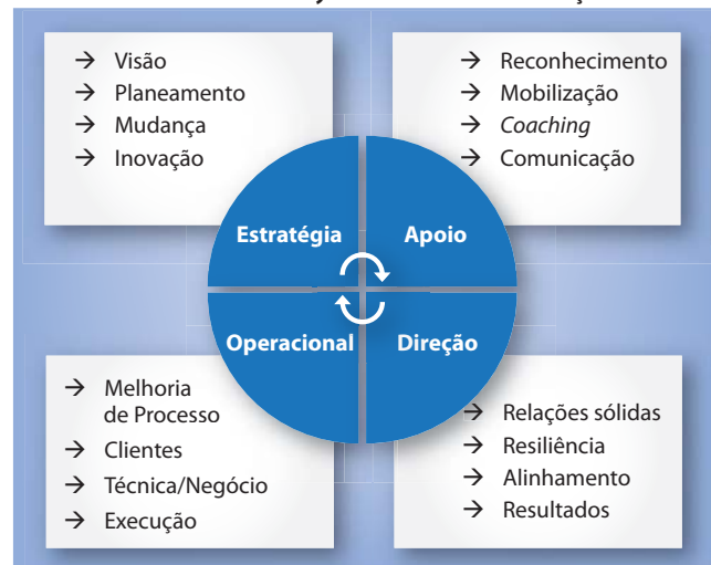
Gráfico 2 – LiderWays - Dimensões de Avaliação

Um modelo de avaliação do estilo preferencial de avaliação deverá pois ter em conta estes dois eixos. Um eixo de Orientação Estratégica vs Orientação Operacional , que retrata a orientação preferencial da energia da pessoa. E um eixo de Orientação para o Apoio (Pessoas) ou para a Direção (Processos) , que revela a forma preferencial como essa energia é usada (gráfico 2).